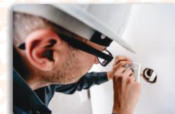
Treinamento NR 10 - Segurança em Instalações e Serviços em Eletricidade