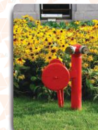
Elaboração e Execução de Prevenção e Combate a Incêndio