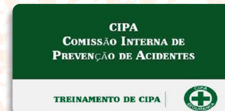
Treinamento NR 05 - Comissão Interna de Prevenção de Acidentes - CIPA