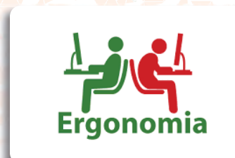
Emissão de Laudo Ergonômico - NR 17