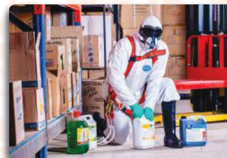
Treinamento NR 06 – Equipamento de Proteção Individual – EPI