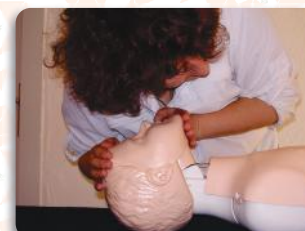
Treinamento NR 07 - Primeiros Socorros