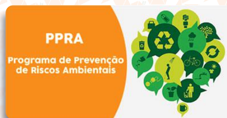
Elaboração de PPRA