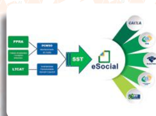
Consultoria, Mapeamento, Diagnóstico e Efetiva Implantação do eSocial