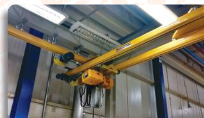
Treinamento NR 11 - Segurança na Operação de Ponte Rolante