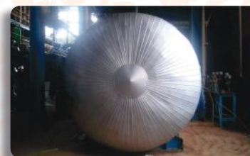
Funilaria Industrial para Isolamento Térmico e Isolamento Térmico em Geral