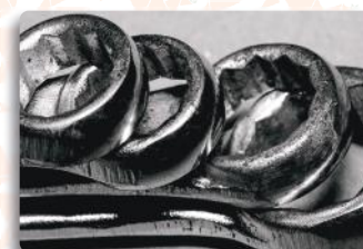
Manutenção em Equipamentos Diversos