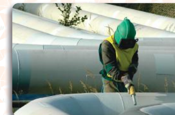
Jateamento e Pintura em Tanques, Dornas, Caldeiras, Moendas, Tubulações e Estruturas Metálicas