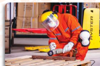
Rigor no Atendimento à Legislação de Saúde e Segurança do Trabalho