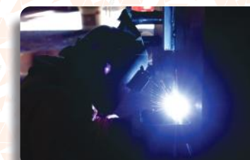
Soldas e Usinagem