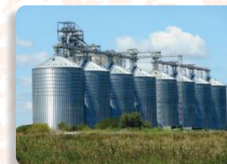
Fabricação e Montagem de Silos, Tanques, Dutos e Chaminés