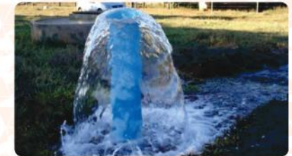
Outorga para Uso de Recursos Hídricos