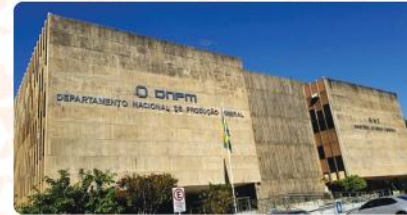
Relatórios DNPM (atual ANM - Agência Nacional de Mineração)