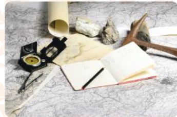
Mapeamento e Consultoria em Áreas com Potencial Geológico