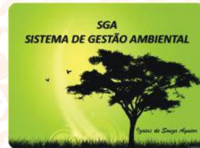
Gestão Ambiental – Implantação de Políticas e Sistemas Ambientais e Treinamento de Educação Ambiental