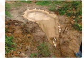
Revitalização de Nascente