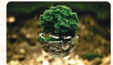
Gestão de Resíduos