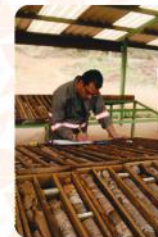
Descrição e Amostragem em Testemunhos de Sondagens. Implantação de Qa/Qc e Auditoria de Banco de Dados